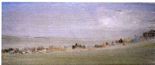
Jean GUY - " Vue de Ludes " - Huile sur bois -15 x 33 cm