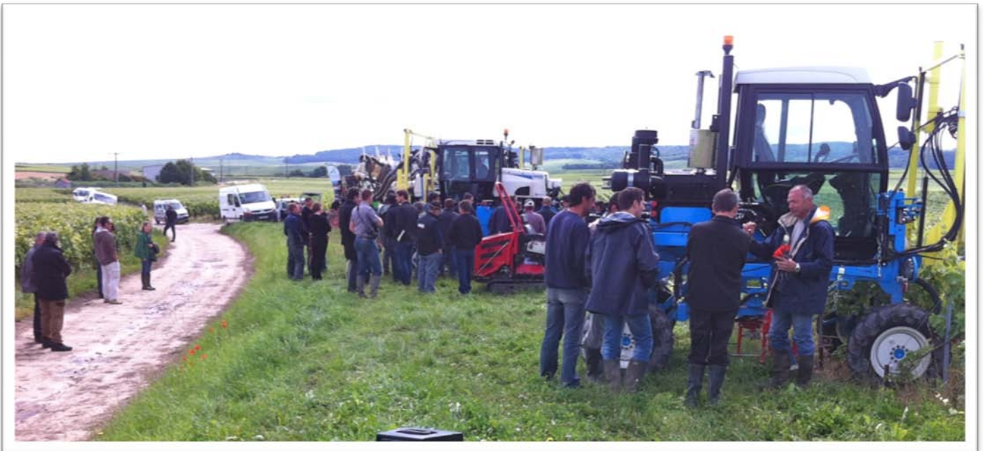
Journée de démonstration pour l'entretien du sol du 12 Juillet 2012