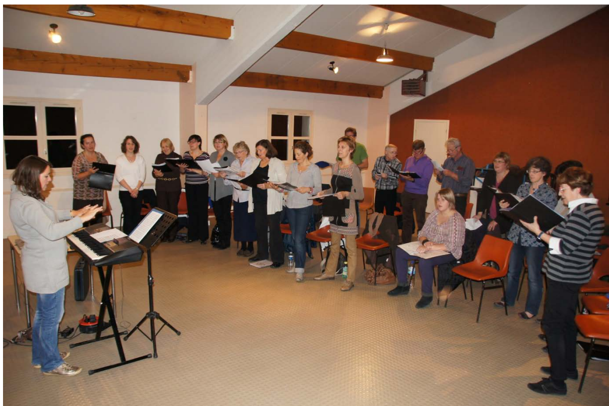
répétition du jeudi 11 octobre